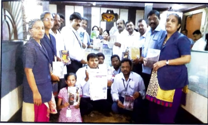
कुसुमाग्रज प्रतिष्ठान व महाराष्ट्र शासन संचालित 'ग्रंथ तुमच्या दारी' योजनेचा मुख्य कार्यालयात शुभारंभ करताना संस्थेचे संचालक व कर्मचारी.