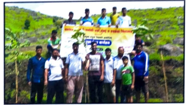
संस्थेच्या वतीने मौजे तुस्कवाडी (कोल्हापूर) येथे राबविण्यात आलेल्या वृक्षारोपण कार्यक्रम प्रसंगी संस्थेचे कर्मचाऱी.