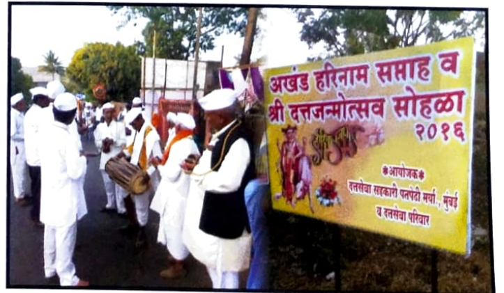
दत्त जयंती निमित्त अखंड हरिनाम सप्ताह व दिंडीची क्षणचित्रे.