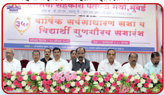
३५ व्या वार्षिक सर्वसाधारण सभेप्रसंगी उपस्थित संस्थेचे संचालक मंडळ